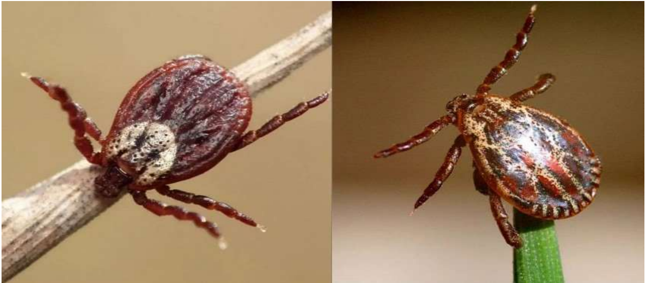
Фото 2: клещи рода Dermacentor (слева самка, справа самец)