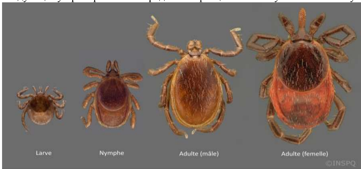
Фото 1: слева на право: личинка, нимфа, самец, самка.

Иксодовые клещи – мелкие членистоногие длиной в голодном состоянии 2-6 мм. Тело плоское, овальной формы, покрытое мраморным или черным щитком. У самок щиток закрывает тело на половину, у самцов – полностью. Жизненный цикл состоит из фазы яйца, личинки, нимфы и взрослой особи (фото 1). Чтобы перейти из одной стадии в другую, им необходимо напитаться кровью. Во время кровососания клещи заражаются возбудителями различных инфекционных заболеваний и при присасывании к следующему прокормителю передают инфекцию человеку или животному.