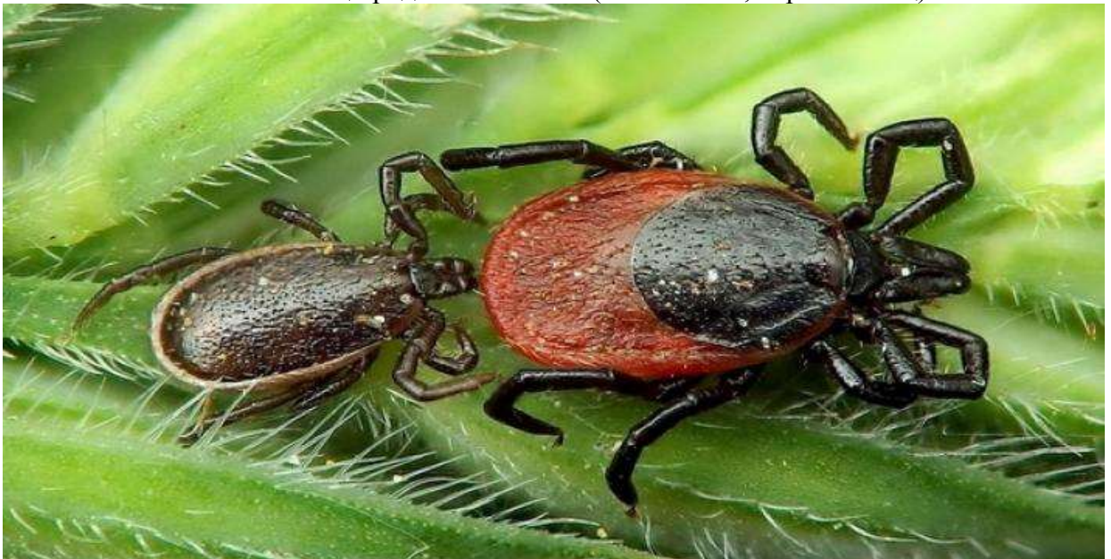
Фото 3: клещи рода Ixodes (слева самец, справа самка)

Любимые места обитания клещей являются умеренно затененные, увлажненные лиственные и смешанные леса. Они концентрируются вдоль лесных тропинок (здесь их значительно больше, чем в окружающем лесу), на просеках, на старых вырубках, у берегов водоёмов, где высокая трава и хорошо развит кустарник. Их можно встретить в лесопарковых зонах городов, на дачных участках. Клещи заносятся в дом на одежде, с домашними животными, букетом полевых цветов и т.д.